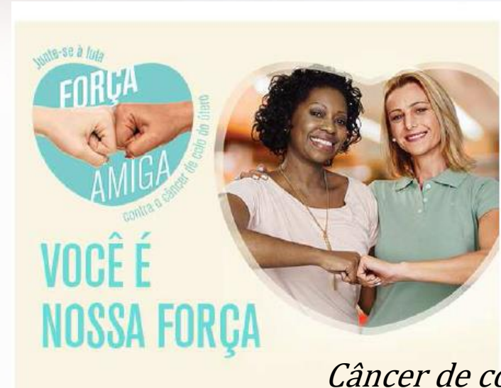
Câncer de colo do útero