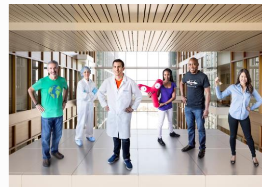
Saúde do colaborador