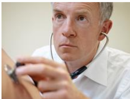
Foco em saúde