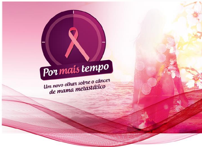
Câncer de mama